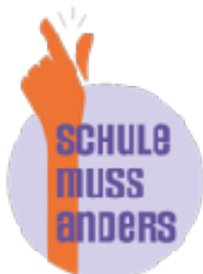
Schule muss anders